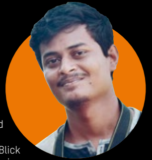
Fotograf Azad Mohammed zeigt seinen Blick auf das Leben im Camp in Cox's Bazar.

„Es gibt keine Bäume und damit wenig Schatten im Geflüchteten-camp. Die Menschen bleiben deshalb oft in ihren Behausungen, wie dieser Mann. Doch auch hier ist es sehr warm.“