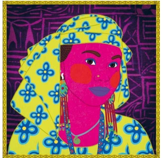
HINDOU OUMAROU IBRAHIM gründete die Vereinigung von Indigenen Frauen und Völkern des Tschads (AFPAT). Sie repräsentiert bei den UN-Klimaverhandlungen die Initiativen indigener Völker und engagierte sich mit Oxfam Deutschland als „Klimazeugin“.