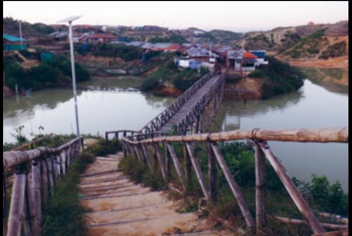
„Blick auf einen Randbereich des Camps. Die meisten Behausungen bestehen aus Planen und Holz.“

„Es gibt keine Bäume und damit wenig Schatten im Geflüchteten-camp. Die Menschen bleiben deshalb oft in ihren Behausungen, wie dieser Mann. Doch auch hier ist es sehr warm.“